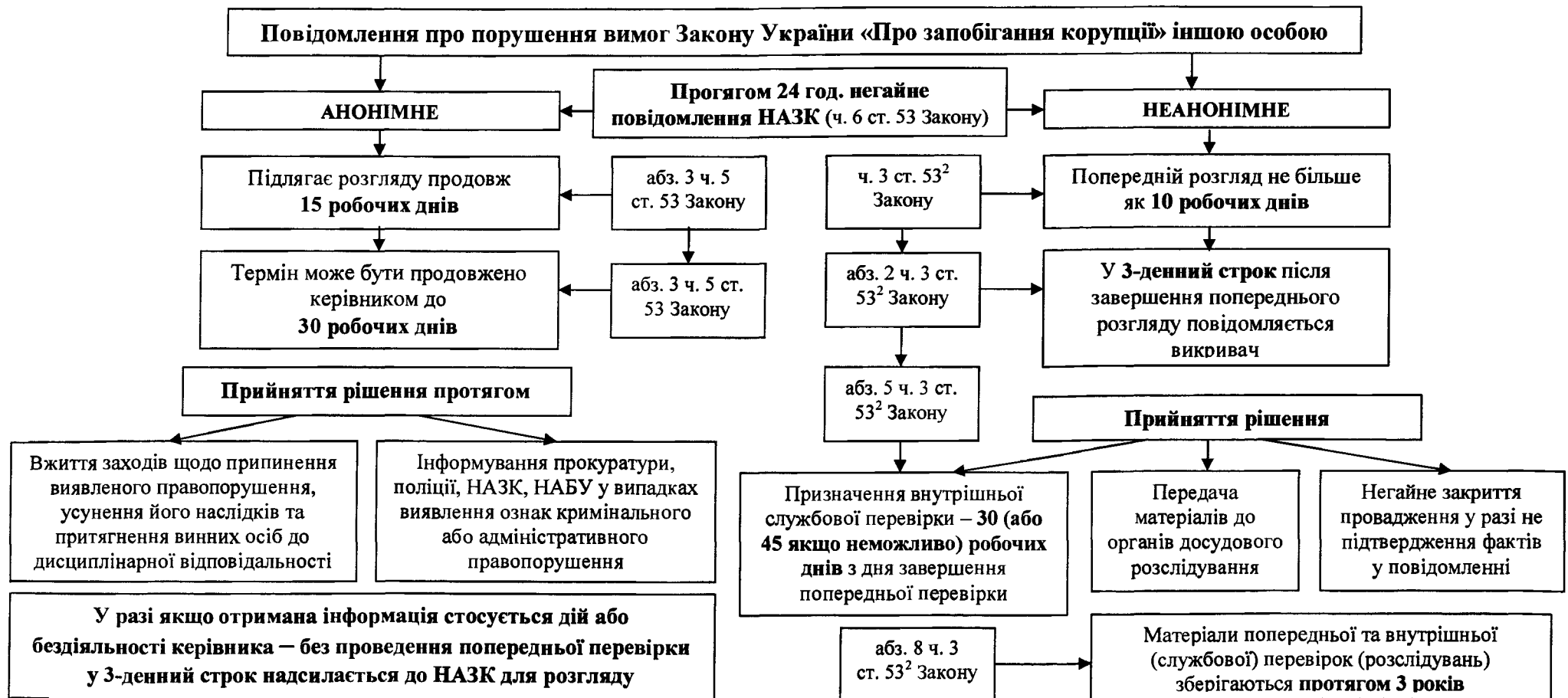
Схема встановлених Законом України «Про запобігання корупції» строків розгляду повідомлень