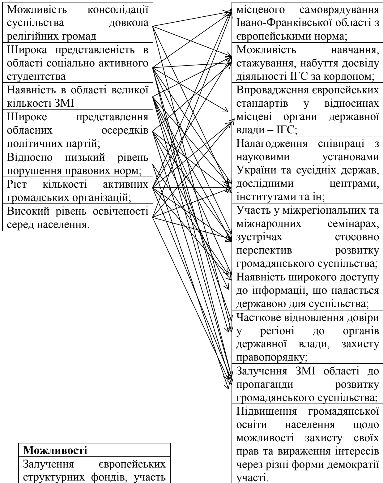
Схема захищених аспектів відображає зв'язки між сильними сторонами області та зовнішніми негативними впливами (загрозами) формування громадянського суспільства і дозволяє визначити які саме сильні сторони суб'єкта дозволяють нівелювати останні.