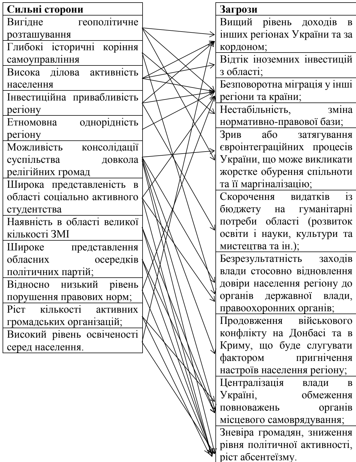
Схема викликів , будується між слабкими сторонами суб'єкта та зовнішніми позитивними можливостями, які дозволяють зменшити вразливість області.