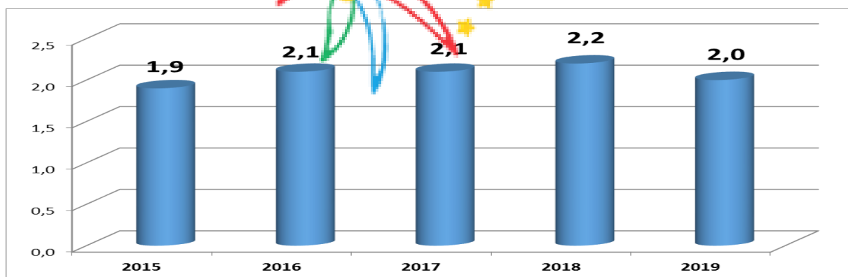
Рис. 1. Динаміка відвідуваності Івано-Франківської області, млн ос. (2015–2019 рр.)

За період 2015–2019 рр. Івано-Франківській області вдалося утримати зростання кількості туристів і екскурсантів, досягнуте після 2014 р., на рівні 2 млн осіб (рис. 1). Надходження туристичного збору зросли з 1.6 млн до 6.1 млн гривень (рис. 2).